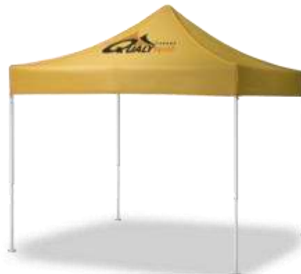
LOGO EN AGUA