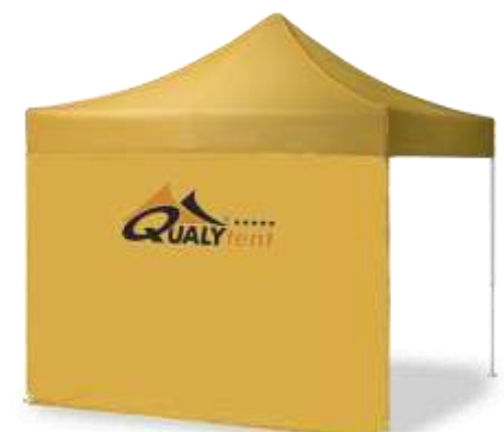
LOGO EN PARED

La termo-impresión es ideal para aplicar logos o textos en las partes más visibles de la carpa: