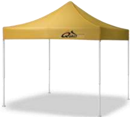
LOGO EN FALDÓN