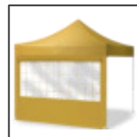
RESCUE OPACA + MOSQUITERA + TRANSPARENTE