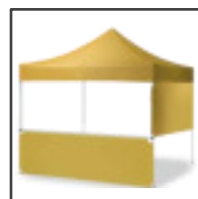
MEDIA PARED INF. MEDIA PARED SUP.