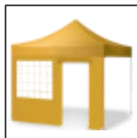
PUERTA + VENTANA