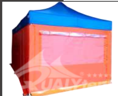
MOSQUITERA + OPACA INTERNA