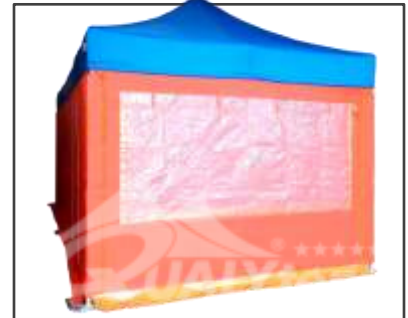
MOSQUITERA + OPACA+ TRASPARENTE EXTERNA

Las paredes RESCUE Qualytent están compuestas por: