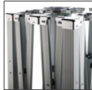
PIEZAS DE UNIÓN ALUMINIO FUNDIDO