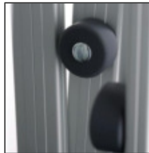
BOLÓN PROTECTOR TECHO