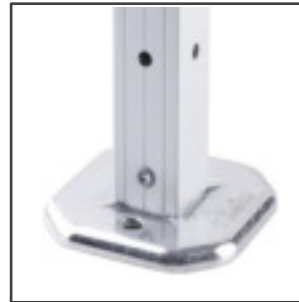
BASE REFORZADA DE ALUMINIO FUNDIDO