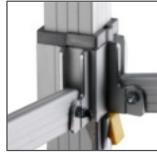
PULSADOR DE SEGURIDAD