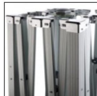
PIEZAS DE UNIÓN ALUMINIO FUNDIDO