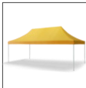
QUALYTENT 6X4 m