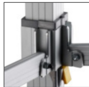
PULSADOR DE SEGURIDAD