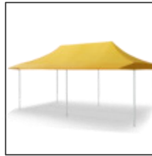
QUALYTENT 6X3m CV