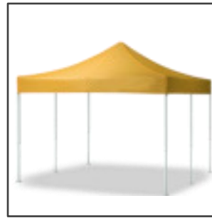
QUALYTENT 5X5m - 6 patas