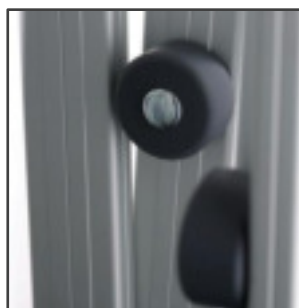
BOLÓN PROTECTOR TECHO