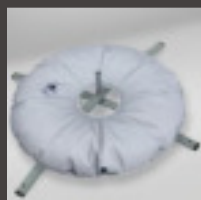
Cruz con flotador