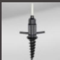
Base de tornillo rosca