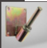
Base para pared