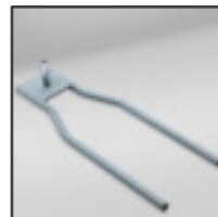
Base para rueda de coche